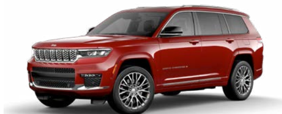
4. ヴェルヴェットレッド P/C