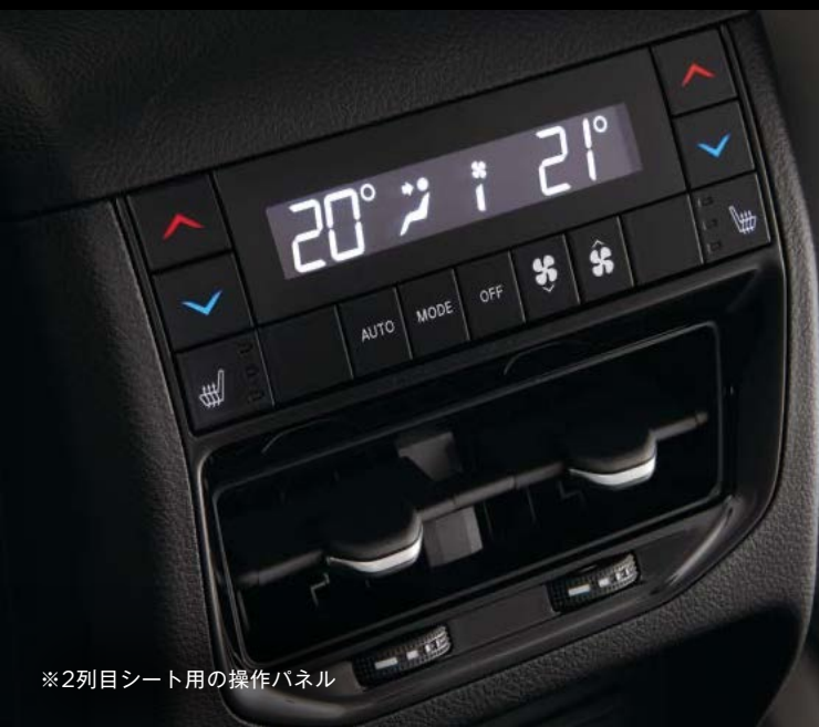
※2列目シート用の操作パネル