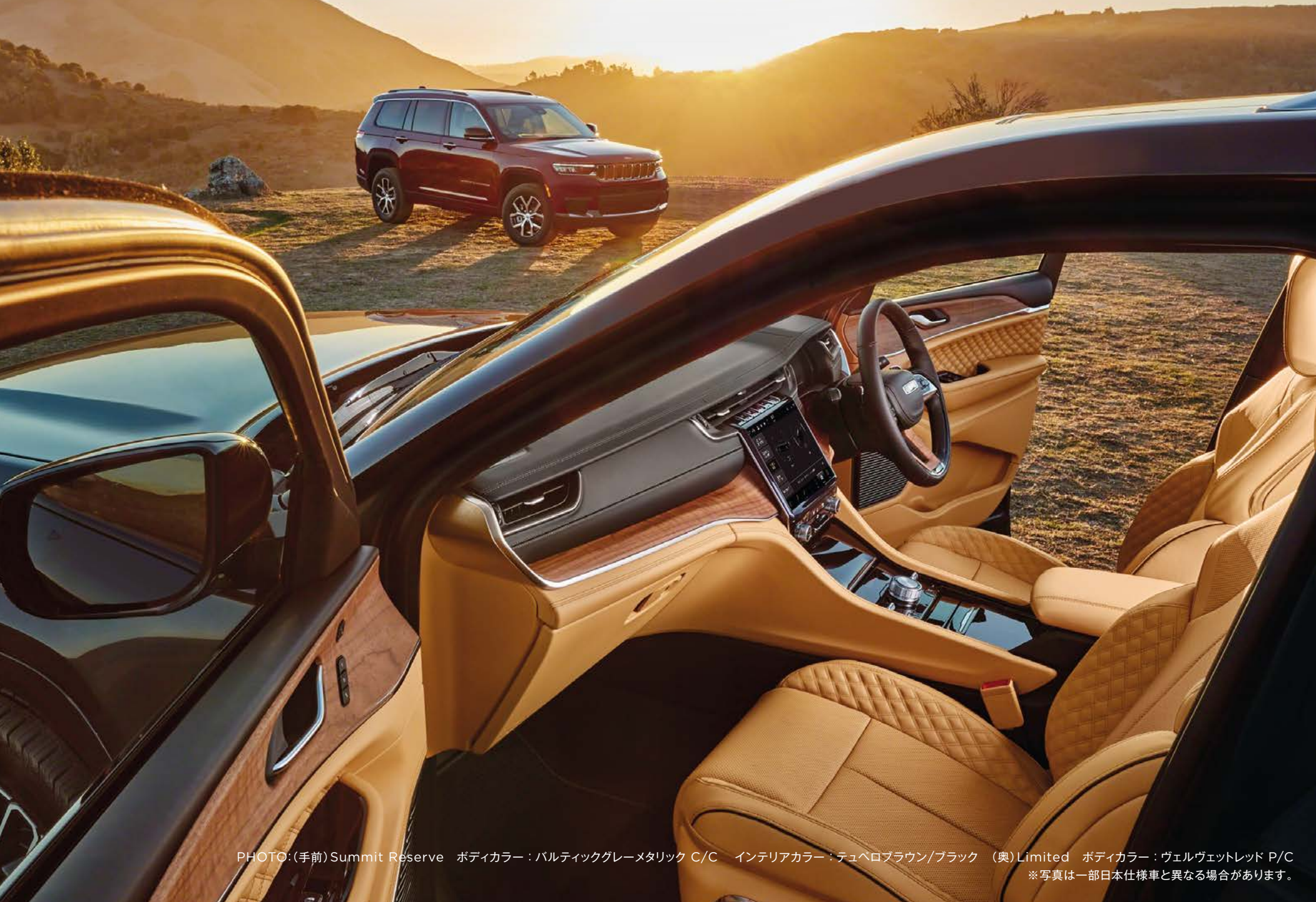
PHOTO: (手前) Summit Reserve ボディカラー：バルティックグレーメタリック C/C インテリアカラー：テュベロブラウン/ブラック (奥) Limited ボディカラー：ヴェルヴェットレッド P/C ※写真は一部日本仕様車と異なる場合があります。