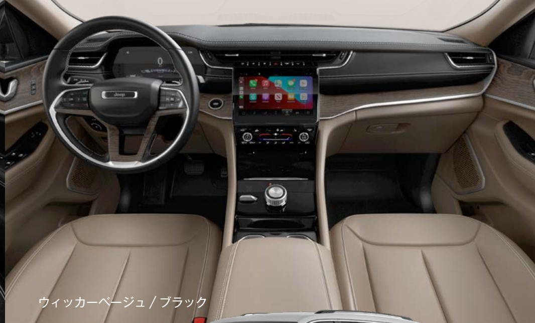
ウィッカーベージュ / ブラック