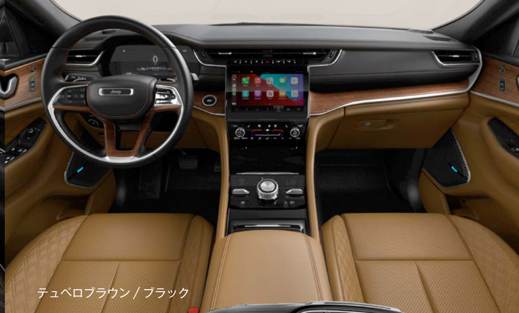
テペロブラウン / ブラック