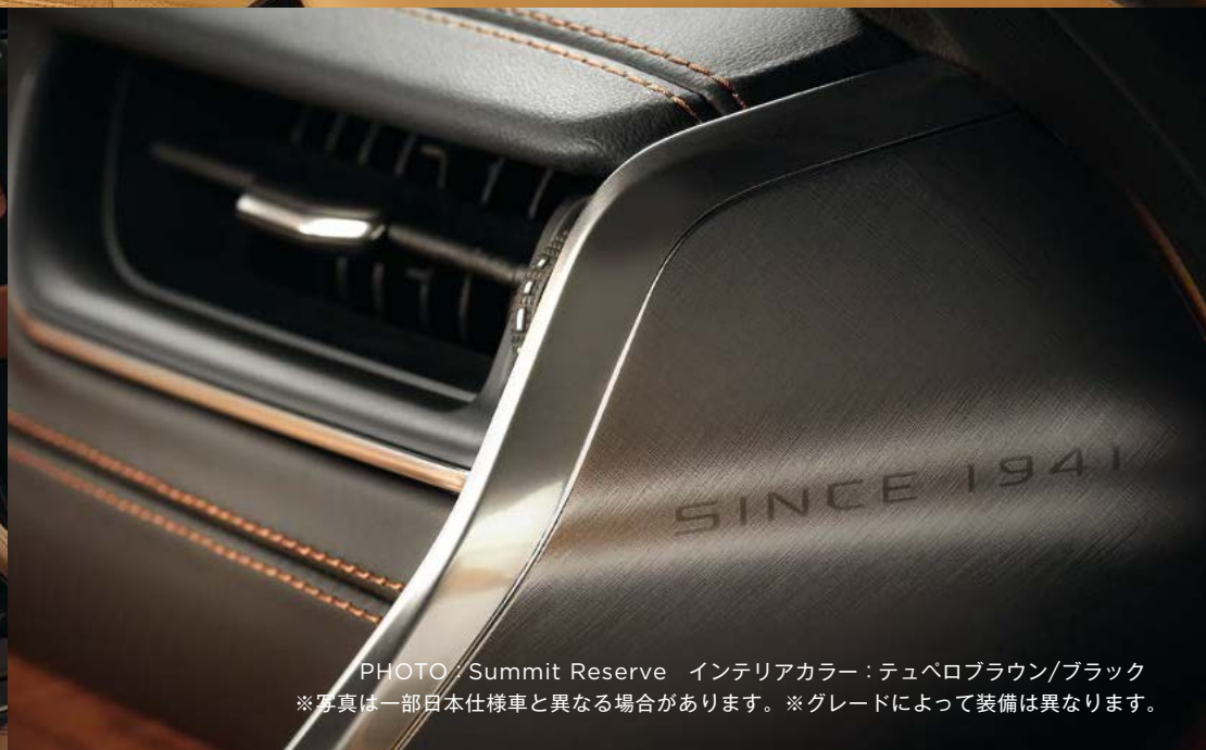
PHOTO / Summit Reserve インテリアカラー：テュベロブラウン/ブラック ※写真は一部日本仕様車と異なる場合があります。※グレードによって装備は異なります。