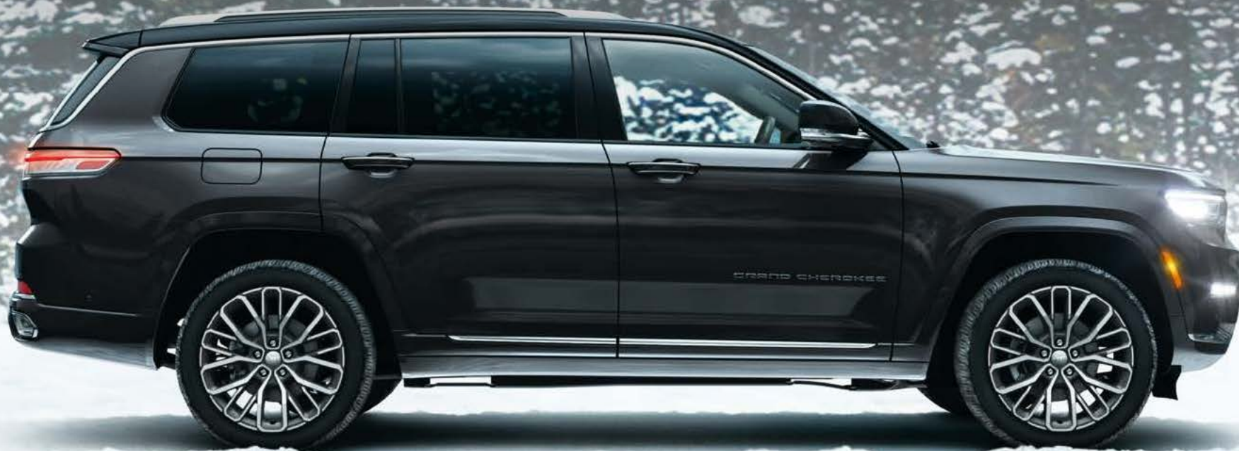
PHOTO : Summit Reserve ボディカラー：バルティックグレーメタリック C/C ※写真は一部日本仕様車と異なる場合があります。

ラグジュアリーSUVの先駆けWagoneerのDNAを受け継ぐ伝統のスタイリング。 力強さと美しさが融合するダイナミックなフォルムは、フラッグシップを語るにふさわしい 圧倒的な存在感を放ちます。