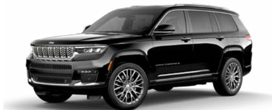
1. ダイヤモンドブラッククリスタル P/C