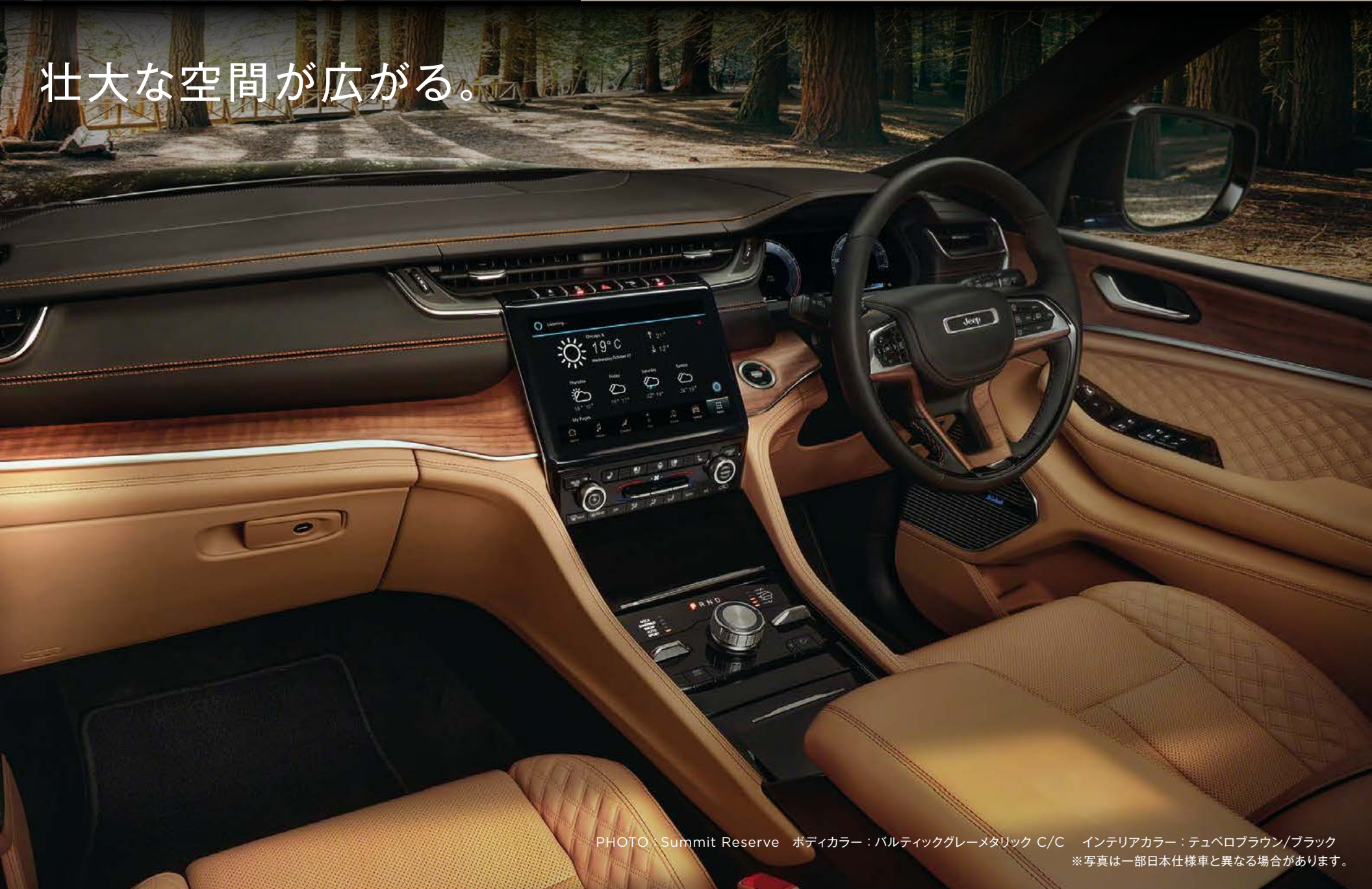
PHOTO : Summit Reserve ボディカラー : パルティックグレーメタリック C/C インテリアカラー : テュベロブラウン/ブラック ※写真は一部日本仕様車と異なる場合があります。