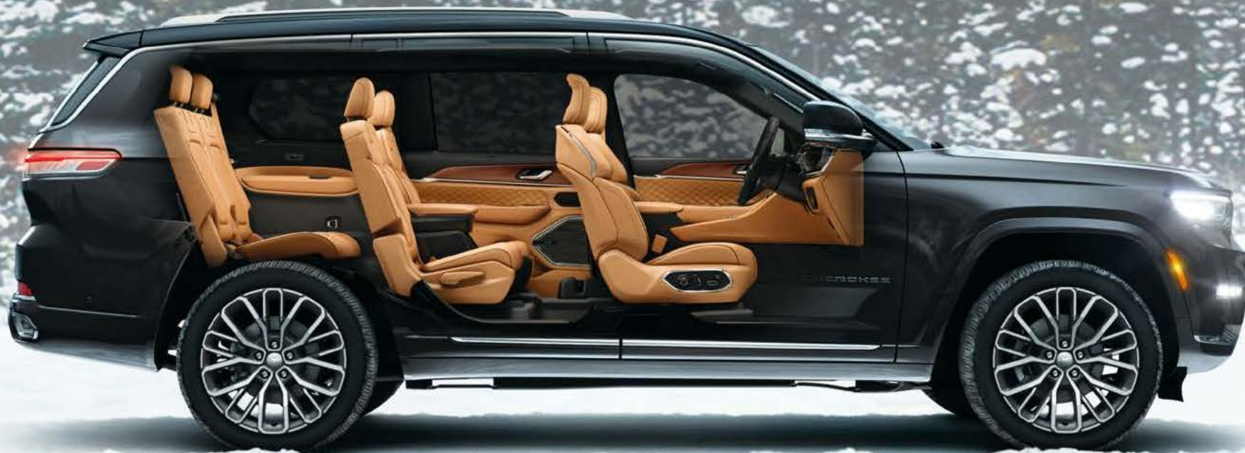
PHOTO : Summit Reserve ボディカラー : パルティックグレーメタリック C/C インテリアカラー : テュベロブラウン/ブラック ※写真は一部日本仕様車と異なる場合があります。

上質で艶やかなレザーやハイエンドな室内装備、近未来テクノロジーが息づく 広大な居住空間と次世代の安全性能が、オフローダーの概念を一変させる、 どこまでも静かで豊かな時間をもたらします。