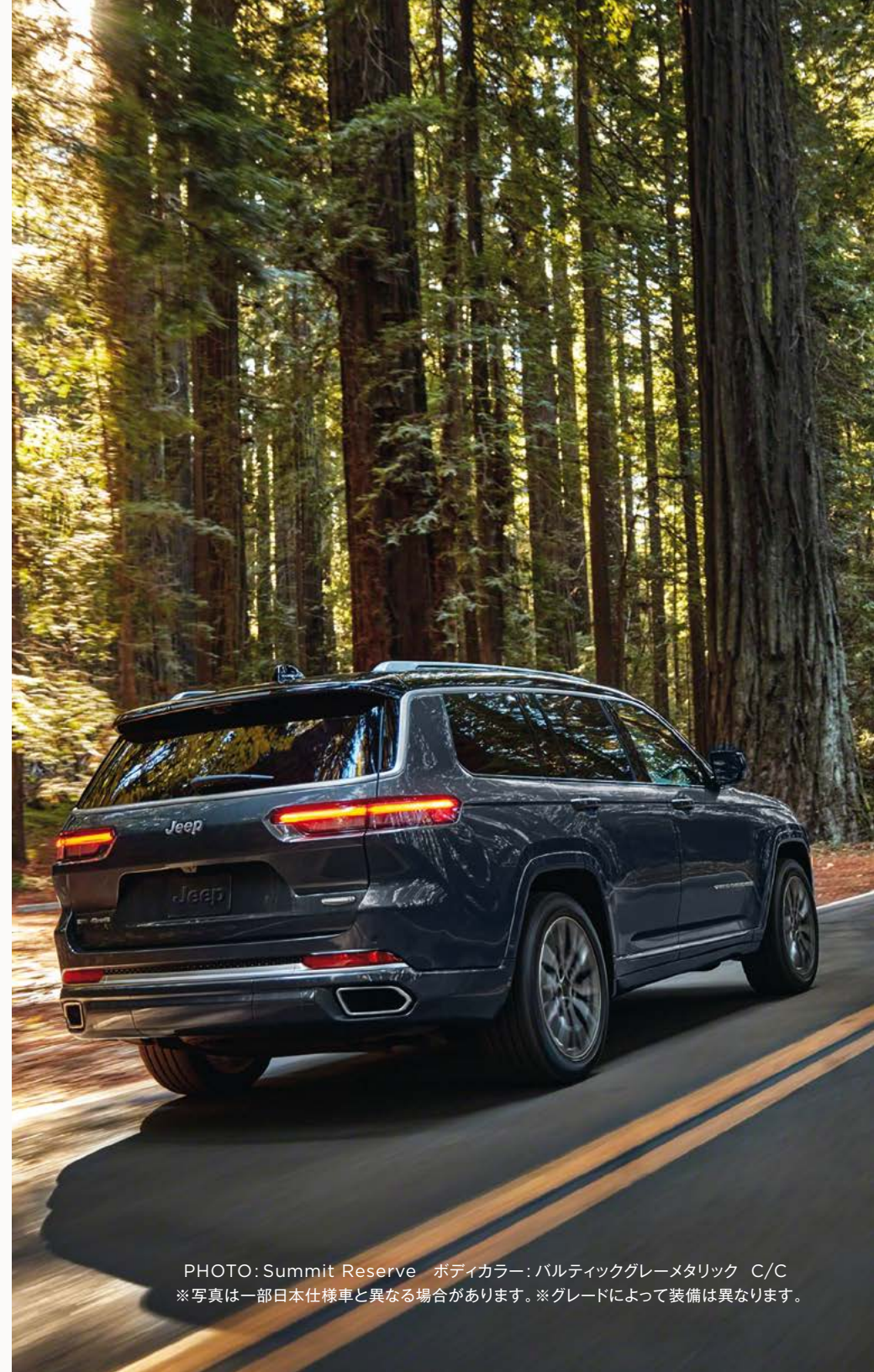
PHOTO: Summit Reserve ボディカラー: バルティックグレーメタリック C/C ※写真は一部日本仕様車と異なる場合があります。※グレードによって装備は異なります。

*4:衝突被害軽減ブレーキの作動には一定の条件があります。また道路状況、車両状態、天候状態およびドライバーの操作状態等によっては作動しない場合があります。ドライバーは本機能を過信せず、細心の注意をはらって運転操作を行ってください。*5:車線変更前には必ず周りの車両を目視で確認してください。*6:ParkSense®縦列 / 並列パークアシスト・アンパークアシストは駐車時の補助機能です。駐車場のスペースや状況により作動しない場合もございます。車両の操作をするときは周囲の安全を目視やミラーで直接確認し、適切な運転操作を行ってください。*7:インターセクションコリジョンアシストは交差点右折時の対向車の動向を監視するシステムで、車両の動作を制御し衝突を回避するための措置を講じる機能ではありません。