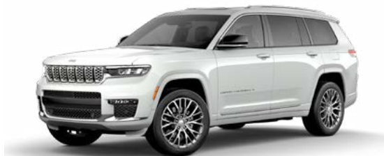
2. ブライトホワイト C/C