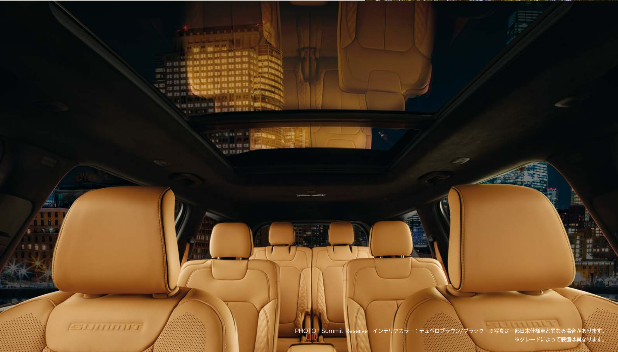
PHOTO : Summit Reserve インテリアカラー : テュベロブラウン/ブラック ※写真は一部日本仕様車と異なる場合があります。 ※グレードによって装備は異なります。