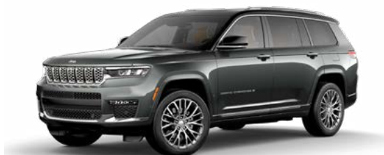
3. バルティックグレーメタリック C/C