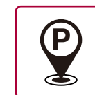
駐車録画モード (モーションorタイムラプス)