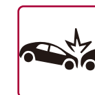
衝撃検知機能 搭載