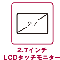
2.7インチ LCDタッチモニター