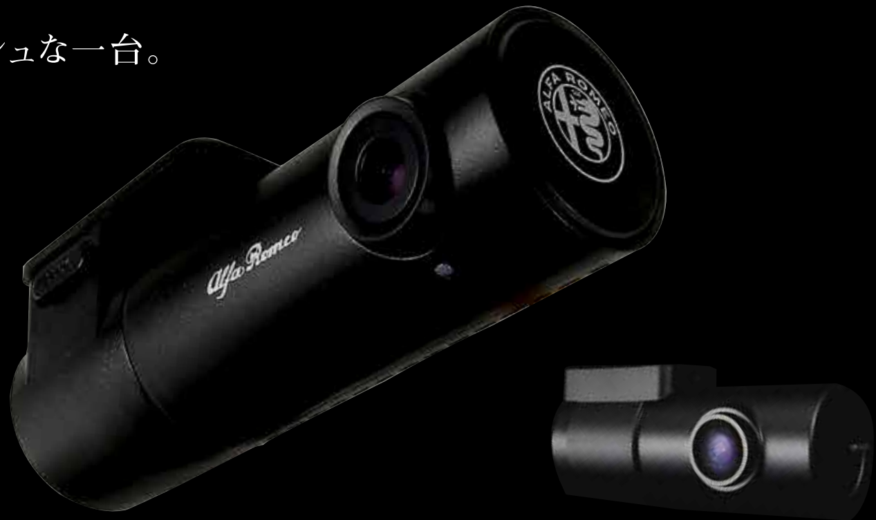
フロント・カメラ