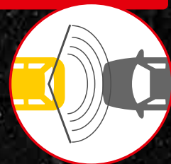
140°の広角ワイドカメラ

広範囲140°の撮影が可能なFull HD高画質カメラをリアにも採用。後方車両のナンバーはもちろん、別レーンからの危険な侵入なども鮮明に録画します。